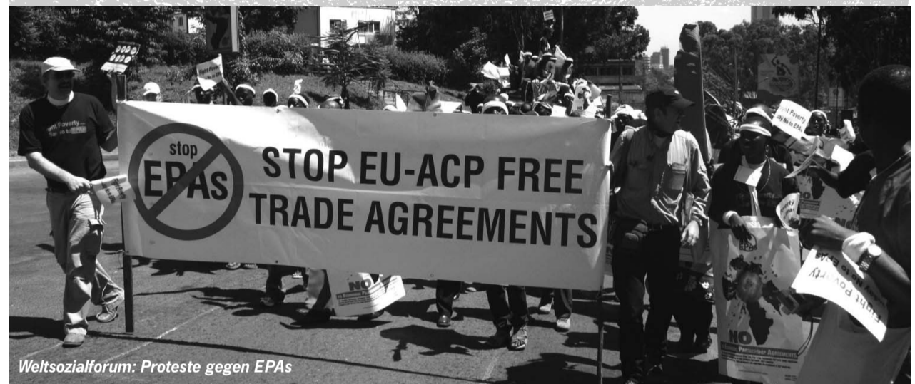
Weltsozialforum: Proteste gegen EPAs

EPAs verfehlen das von der EU immer wieder beschworene Ziel, dass das Cotonou-Abkommen ein umfassendes Entwicklungsabkommen sein soll, da die eingebaute Freihandelspolitik die anvisierten Entwicklungsziele ständig konterkariert. Die übermächtige Konkurrenz der EU wird zur Zerstörung lokaler Märkte führen. Autonome Ansätze regionaler Integration werden durch den Freihandel mit der EU unterminiert. Die für die AKP-Staaten im Vergleich zur EU höheren Anpassungskosten und die daraus resultierenden geringeren Staatseinnahmen, sowie die von der EU geforderten Privatisierungen im öffentlichen Sektor reduzieren die ohnehin schon durch Strukturanpassungsmaßnahmen geschwächte politische, wirtschaftliche und soziale Steuerungsfähigkeit der jeweiligen Regierungen weiter.