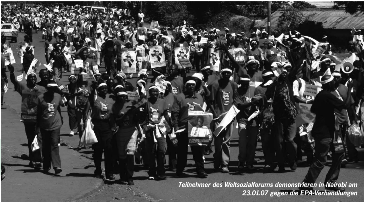
Teilnehmer des Weltsozialforums demonstrieren in Nairobi am 23.01.07 gegen die EPA-Verhandlungen